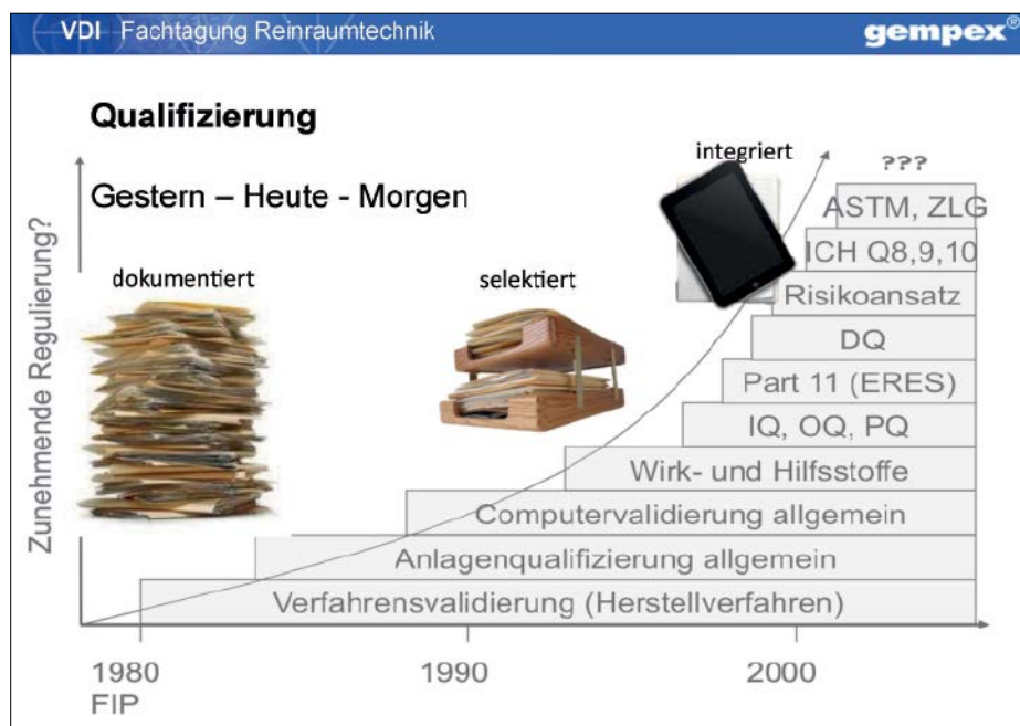
Abb. 1: Regulatorische Entwicklung Qualifizierung

Im ASTM E2500 Standard werden die oben bereits beschriebenen Themen „risikobasiertes Vorgehen“ und „Nutzung von Herstellerunterlagen bzw. -tests“ als Schlüsselemente herausgestellt. Es wird aber weiter auch auf „wissenschaftsbasierte Vorgehensweisen“, auf „kritische Aspekte“ der Herstellsysteme, auf den